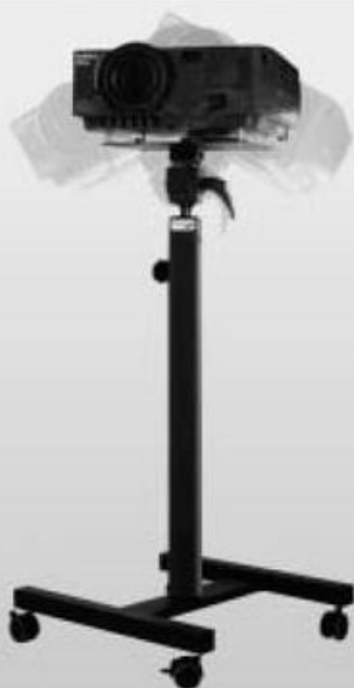
H = 85-135 cm Art.-Nr. 100239