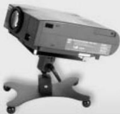
H = 25 cm Art.-Nr. 100240